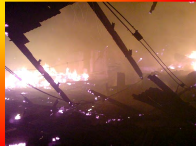
Scheunenbrand Gremersdorf 04.11.2009 03:11 Uhr