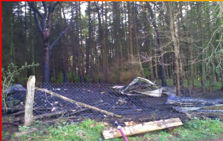
Blockhütte in Drechow gebrannt am 30.04.2009 um 16:53 Uhr