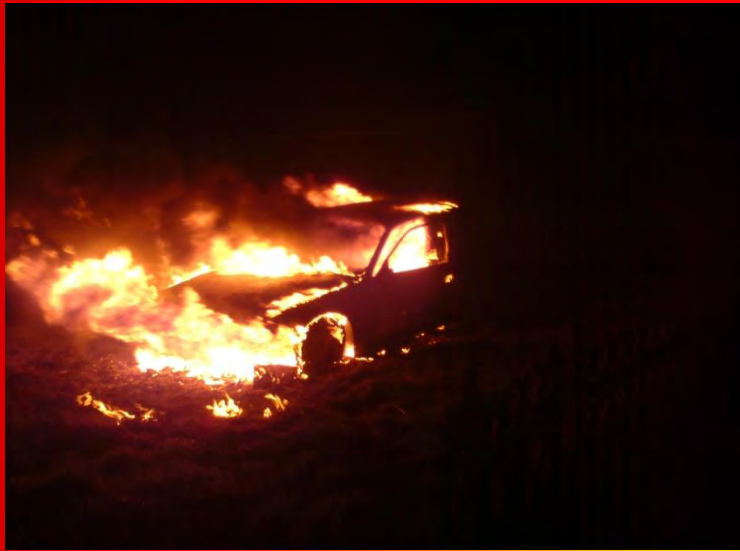
PKW Brand Krakow 19.01.2009 um 00:30 Uhr