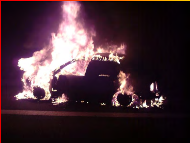
PKW Brand A 20 11.10.2009 22:25 Uhr