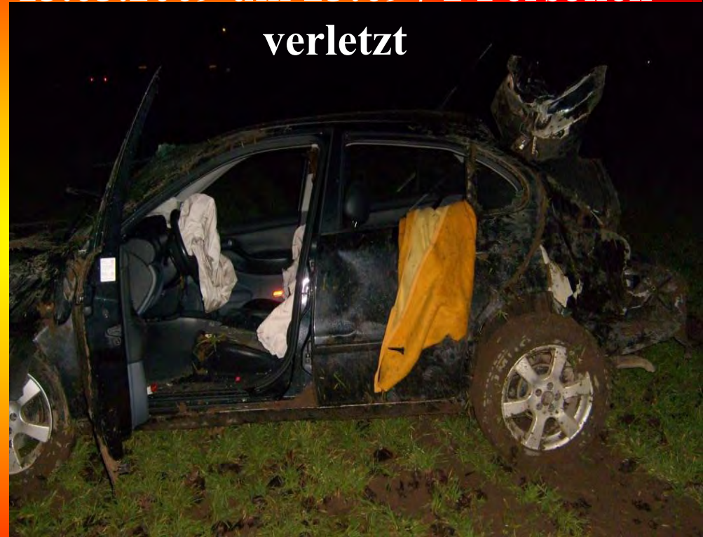
PKW überschlagen L192 am 13.03.2009 um 23:09 / 2 Personen verletzt