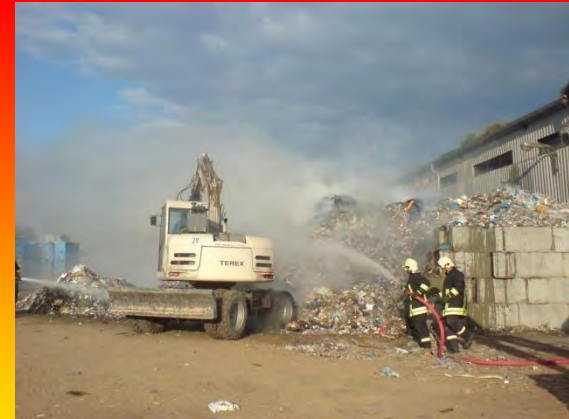
Brand Veolia 03.09.2009 17:44 Uhr